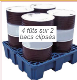
4 fûts sur 2 bacs clipsés

Bac de rétention clipsable pour 2 fûts. Clips intégrés permettant de composer un ensemble modulable en assemblant plusieurs bacs entre eux pour stocker 4, 6, 8 fûts, des maxi fûts ou des cuves de 1000 litres (nombreuses combinaisons possibles).